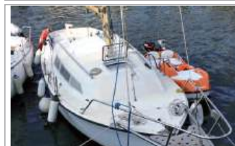
Beneteau Baroudeur 8 metri, entro-bordo Craftsman 16 HP diesel, 2 batterie, euro 14.000 trattabili, tel. +39 059/468219 - www.mon-torsisport.com