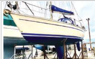
Bavaria 30 timone a barra, motore Volvo Penta 18 HP, Saildrive, 2 cabine, 2 posti dinette, cucina, WC nuovo, salpancora con telec. nuovo, euro 30.000, tel. +39 339/7969276