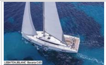
Bavaria C45 4 cabine, 10 posti letto, 3 bagni, prezzo alta stag. euro 4.350, euro 3.450 media stag., euro 2.350 bassa stag., tel. +39 0187/601254 - lebateaublanc@lebateaublanc.it