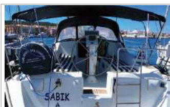
Beneteau Oceanis 393 Clipper 12 m, 3 cabine spaziose, 2 ampi bagni con doccia, refit 2023, tel. +39 347/2733268 - info@carlofortesailcharter.it