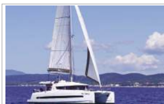
Catana Bali 4.1 Wee Sail , 2019, 12,35 m, Yanmar 2x40 HP, 4+2 cabine, 8+2 posti letto, 4 bagni, base Marina di Stabia, tel. +39 338/1094098 - www.aladarsail.com