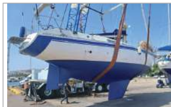
Cantieri del Trasimeno motore Nanni diesel EB 58 HP, portata persone 10, 2 cabine, 2 bagni, 9 posti letto, randa, fiocco, gennaker, spinnaker, euro 29.900, tel. +39 345/4453668