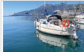
Brigand 950 buone condizioni, pronta per navigare, eventuale posto barca disponibile presso il molo Manfredi di Salerno, euro 10.000, WhatsApp +39 349/0909411