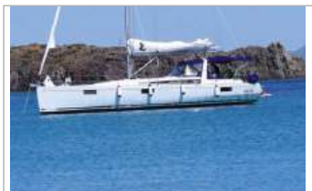
Beneteau Oceanis 48 14,68 m, 5 cabine, 3 bagni, plancia poppa a funz. elettronico, combina lusso, funzionalità e performance, tel. +39 347/2733268 - info@carlofortesailcharter.it