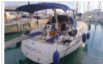
Bavaria 32 Cruiser natante, motore Volvo Penta D20 HP, interni/esterni appena rinnovati, carena fatta maggio 2024, elica 3 pale sostituita, euro 77.800, tel. +39 339/7830880