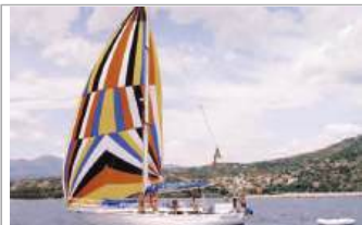
Aquamarine Laurent Giles , 12 metri, pescaggio 1,80 m, scafo in acciaio, chiglia lunga, Cutter con trinchetta bomata, accessoriata, vis. Sapri, euro 65.000, tel. +39 339/2233738