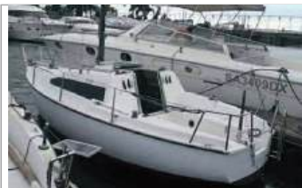
Altura 601 barca a vela senza motore, euro 2.500, tel. +39 339/4913449