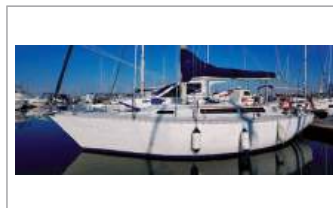
Cantiere Barberis Show 34 perfetta, anno 1981, Bukh DV20 revisione 2022, tanti lavori 2019 - 2020, accessoriata, euro 25.000 trattabili, tel. +39 333/4393038