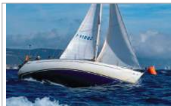
Cantiere del Pardo Grand Soleil 343 10,42 m, velatura 65 mq, teak nuovo, motore anno 2003, tanti accessori, euro 36.000, tel. +39 333/4708970