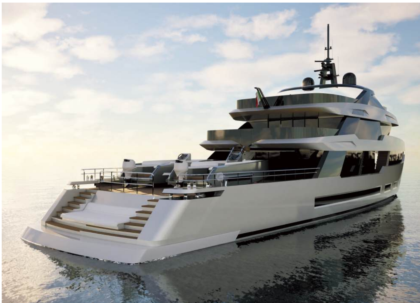
Amer 42 Explorer è stato progettato per lunghe navigazioni oceaniche con particolare attenzione all'efficienza energetica e alla riduzione dei consumi.