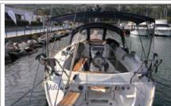
Bavaria 36 Cruiser condizioni eccellenti, 3 cabine, 1 bagno, appena refittata, nessun lavoro da eseguire, numerosi accessori, vis. Palmi (RC), euro 65.000, tel. +39 340/7124973