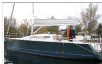
Cobra 33 Fast Cruiser , natante, 2011, veloce e divertente, buona abitabilità interna/esterna, molte dotazioni comprese, sempre acqua dolce, vis. Arona, euro 60.000, tel. +39 329/2215418