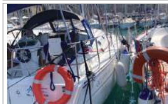
Beneteau Oceanis Clipper 331 in eccellenti condizioni, vele ottimo stato, motore 30 HP, 2 cabine, WC, ruota timone maggiorata, accessoriata, euro 59.900, tel. +39 328/4176977