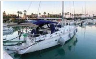
Beneteau Oceanis 411 pari al nuovo, compl. refittata anni 2022-2025, sostituito tutto dalle sartie agli impianti, dai tessuti alla strumentaz., euro 95.000, WhatsApp +39 328/0329673