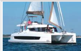
Bali Catspace 2025 , 12,31 m, 4 cabine, 4 bagni, base Capo d'Orlando (Sicilia), da euro 5.058 (settimana 7 giugno), tel. +39 06/94507580 - info@barcandocharter.com