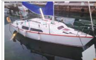
Barca a vela Paolo Cori 8 m, lavori da terminare, 2 motori di cui 1 entro-bordo diesel da 15 CV, genoa, rolla-fiocco, 2 rande, molto altro, euro 5.500, tel. +39 338/2357693