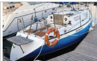
Canados 33 10 m, anno 1980, motore Beta Marine 2007 da 28 HP, in ottime condizioni, necessita solo di piccole manutenzioni, euro 16.000, tel. +39 392/4812420