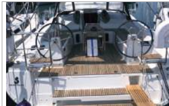
Beneteau Oceanis 40.1 (Hadar) 2023, 12,43 m, 4 cabine, 2 WC, base Marina di Portisco, prezzo 27/06-04/07 euro 3.990, tel. +39 0789/25944 - info@cruisingcharter.it