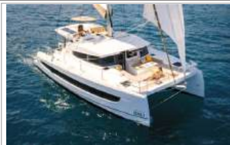
Bali 4.2 2023 , 12,85 m, 4 cabine doppie + 1 per skipper, 4 bagni + 1, base Marina di Cecina, da euro 5.602, tel. +39 06/94507580 - info@barcandocharter.com