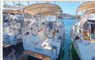
Beneteau Oceanis 30.1 9,53 m, 2 cabine, 1 bagno con doccia, serbatoio carburante 130 l, tel. +39 347/2733268 - info@carlofortesailcharter.it