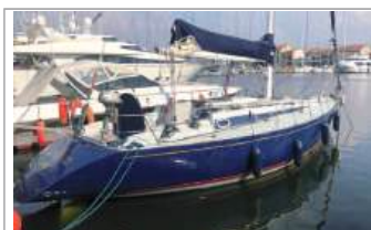
Comet 12 completamente refittata internamente ed esternamente, anno 1987, euro 39.000, WhatsApp +39 338/5706340