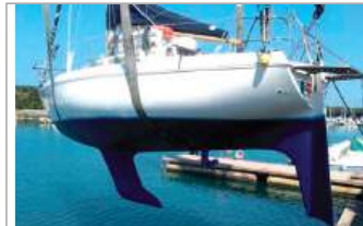
Brigand 950 9,38 m, motore Volvo Penta 3 cilindri 19 HP del 1993, revisione 08/2020, elica 2 pale, euro 13.800, tel. +39 347/8033574