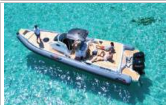
Altamarea Wave 35 noleggio con conducente, Arcipelago di La Maddalena, basi di imbarco Cannigione e Porto Cervo, tel. +39 328/6442195 - www.emeraldfreedom.it