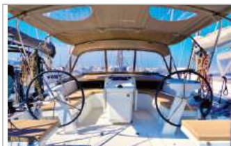
Beneteau Oceanis 46.1 "Ludi" del 2022, 14,6 m, 5 cabine, posti letto, 3 bagni, Yanmar 57 HP, base Marina di Stabia, tel. +39 338/1094098 - www.aladarsail.com