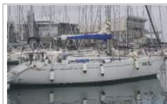
Comet 12 motore Nanni Mercedes 40 HP, pilota automatico Autohelm 7000, randa steccata, avvolgifiocco, trinchetta, randa tempesta, dot. sicurezza, euro 34.000, tel. +39 335/1242006