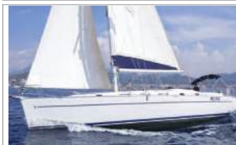
Beneteau Cyclades 43.3 2006, lungh. 13,26 m, 3 cabine, 3 WC, salone, motore Yanmar 53 HP, superaccessoriata, genoa, sprayhood, euro 68.000, tel. +39 347/7414742