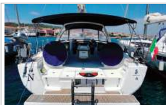
Beneteau Oceanis 45 JN 2016, 13,50 m, ideale per crociera in compagnia, 4 cabine, 2 bagni con doccia, serbatoio carburante 200 l, tel. +39 347/2733268 - info@carlofortesailcharter.it