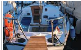
Alpa 9 interni perfetti, motore Yanmar 27 CV, appena tagliandato, ricambi originali, portato a 0 ore, randa mai usata, altri accessori, euro 14.500, tel. +39 351/7366338