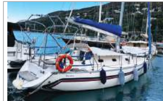
Bonin 30.5 in condizioni eccellenti, pronta alla navigazione, superaccessoriata, tender, fuoribordo, pannello solare da 130W, euro 32.000, tel. +39 334/6798544