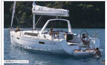
Beneteau Oceanis 45 4 cabine, 10 posti letto, 2 bagni, destinazioni: Elba, Capraia, Sardegna, Golfo del Tigullio, Corsica, tel. +39 0187/601254 - lebateaublanc@lebateaublanc.it