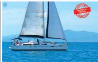
Bavaria Cruiser 50 15,57 m, 2013, Yanmar 75 HP, 5 cabine, 10+1 posti letto, 3 bagni, base Marina di Scarlino, tel. +39 338/1094098 - www.aladarsail.com