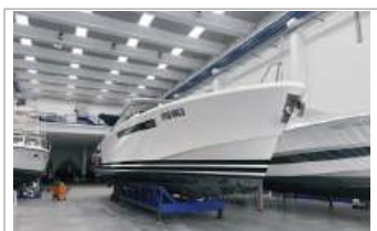
Delta Power 60 2020, 16,63 m, 2x600 HP Volvo Penta, tel. +39 347/1890139 - seatimeyachting@gmail.com