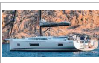
Beneteau Oceanis 51.1 anno 2021, motore 80 HP, 5+1 cabine, 10+2+1 posti letto, 4 bagni, base Marina di Scarlino, tel. +39 338/1094098 - www.aladarsail.com