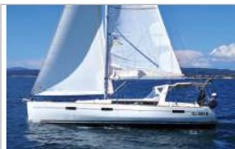
Beneteau Oceanis 45 2017, 13,85 m, 4 cabine, 10 posti letto, 2 bagni, si adatta in modo impeccabile a qualsiasi stile di vita a bordo, tel. +39 345/6604940 - www.aladarsail.com