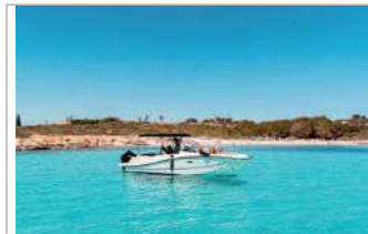
Quicksilver 755 sundeck max 8 persone, 250 HP, ampio prendisole, dinette, 2 posti letto, imbarco Porto di Mahón - Spagna, tel. +34 622309662 - info@isasmenorca.com