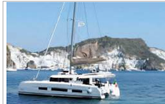
Dufour Catamarans 48 5 cabine + 1, 5 bagni, 1 crew, base Marina d'Arechi, destinazione per costiera Amalfitana, Flegree e Pontine, tel. +41 768377637 - booking@marinayachtcharter.com