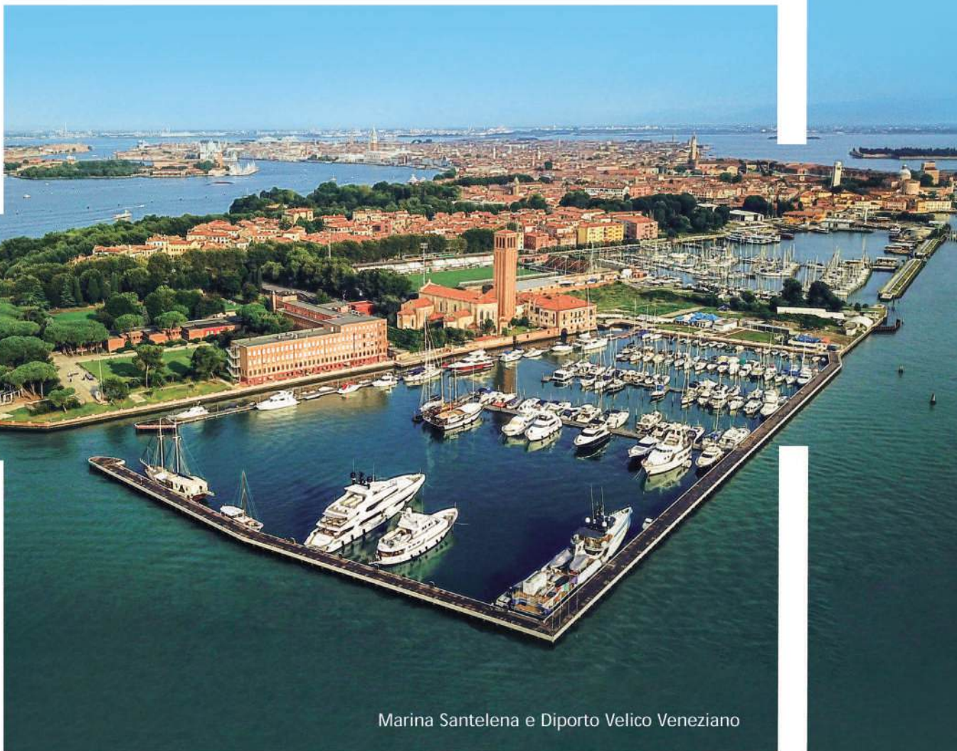
Marina Santelena e Diporto Velico Veneziano