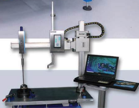
VERSIONE CON PC E SOFTWARE DEDICATO