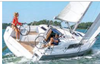
Moorings Oceanis 30.1 10 m, anno 2022, 2 cabine ospiti, 1 bagno, bimini, sprayhood, frigo, tender, imbarco Procida, tel. +39 06/94507580 - info@barcandocharter.com