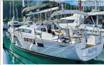
Elan Impression 45.1 13,51 m, 2023, Yanmar 57 HP, base Capo d'Orlando Marina, tel. +39 06/94507580 - info@barcandocharter.com