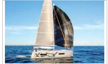
Excess 11 anno 2026, cabine 5, 10 posti letto, bagni 2 (2+1), numerosi comfort, imbarco Gallipoli, tel. +39 06/94507580 - info@barcandocharter.com