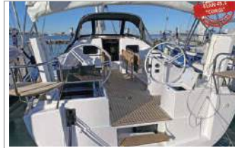
Elan Impression 45.1 anno 2021, 4 cabine, 8+2 posti letto, 2 bagni, base Marina di Cannigione, tel. +39 338/1094098 - www.aladarsail.com