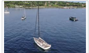
Miss Marie First 53 17 m, 3 cabine ospiti + 1, 4 bagni, sprayhood, inverter, aria condizionata, imbarco Cala dei Sardi, tel. +39 06/94507580 - info@barcandocharter.com