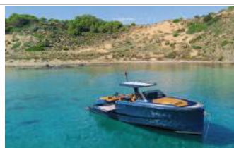
Solaris Power 44 Open max 11 persone, ampi spazi a bordo, cucina, bagno, 2 cabine, imbarco Porto di Mahón - Spagna, tel. +34 622309662 - info@isasmenorca.com