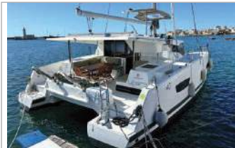
Lucia 40 catamarano confortevole, cabine spaziose, prestazioni di alta qualità, 4 cabine, 4 bagni, lung. 11,73 m, tel. +39 347/2733268 - info@carlofortesailcharter.it