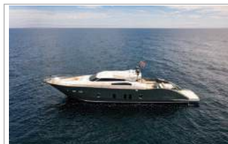
Tecnomar Vevokos 27 metri, 3 cabine, base a Marina d'Arechi, noleggio a Napoli, in Sicilia e in Sardegna, tel. +39 06/87729042 - info@sea-seacharters.com