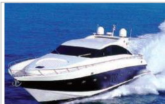
FP Jaguar 24 Sport HT anno 2004, 24 m, 2 MAN da 1.500, 4 cabine, tel. +39 090/9886156 - +39 330/370123 - +39 333/6589768 - info@lipariservice.it