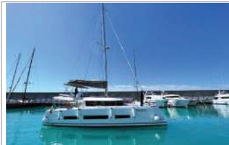
Dufour Catamarans 48 5 cabine + 1, 5 bagni + 1 crew, base Sardegna, Marina di Cugnana, per Costa Smeralda, Tavolara, La Maddalena, tel. +41 768377637 - booking@marinayachtcharter.com