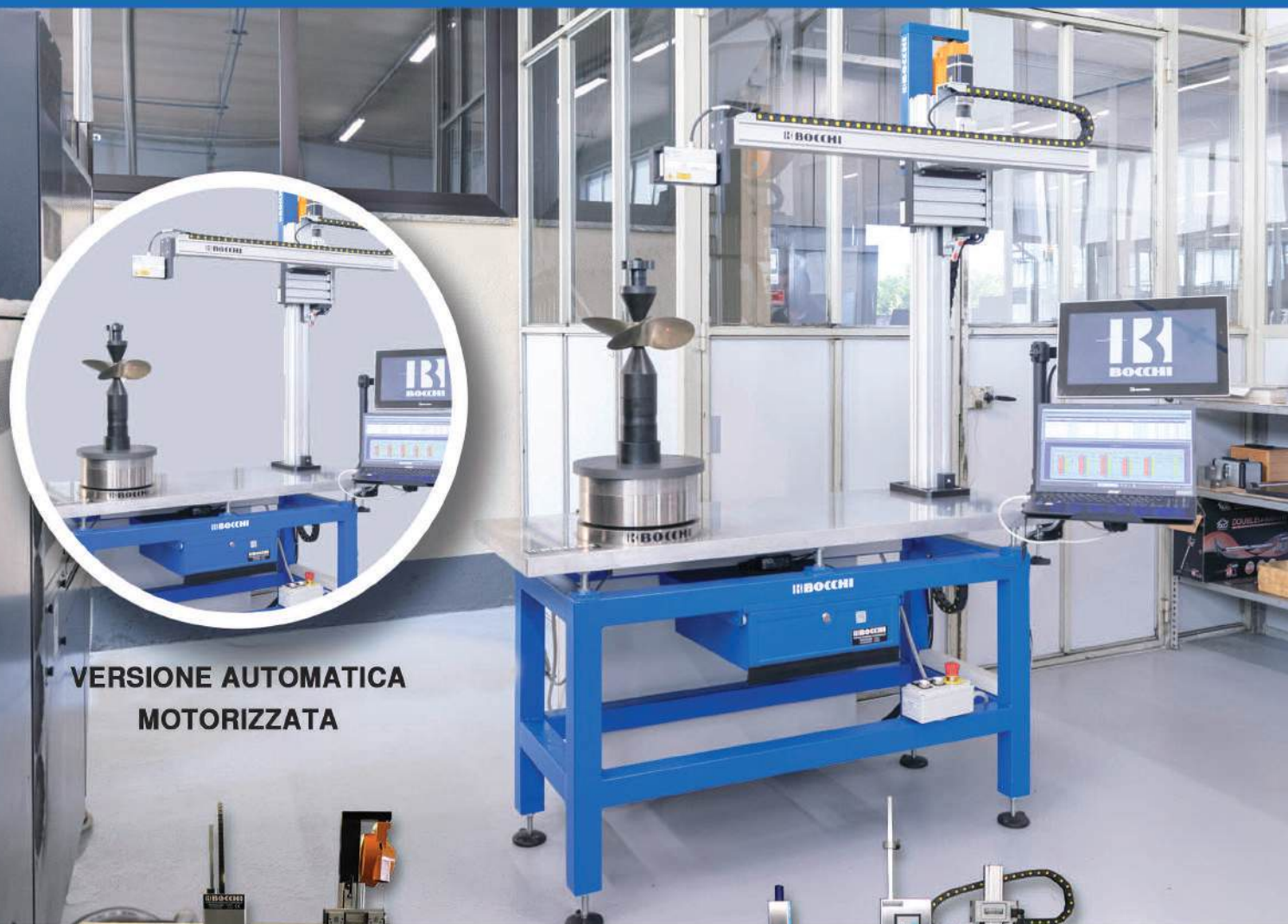
VERSIONE AUTOMATICA MOTORIZZATA

completamente automatico senza la presenza dell'operatore, collegato al PC con software dedicato