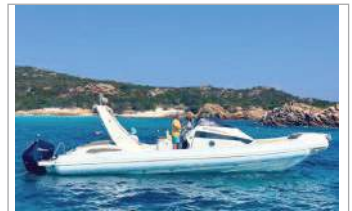
Sea Prop 33 noleggio con conducente, Arcipelago di La Maddalena, base di imbarco Palau, tel. +39 328/6442195 - www.emeraldfreedom.it - info@emeraldfreedom.it