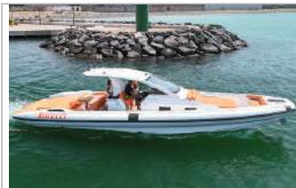
Pirelli 42 13 m, 1 cabina, 1 bagno, 800 HP, frigo, aria condizionata, radio con CD, imbarco Torre Annunziata (NA), tel. +39 06/94507580 - info@barcandocharter.com