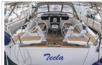
Hanse 388 anno 2023, 10,40 metri, 3 cabine, 7 posti letto, 1 bagno, molto spazio a bordo, ambienti confortevoli e rilassanti, tel. +39 345/6604940 - www.aladarsail.com