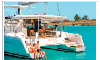
Lagoon 42 anno 2018, lunghezza 12,79 m, motori 2 Yanmar 57 HP, base Lipari, tel. +39 090/9886156 - +39 330/370123 - +39 333/6589768 - info@lipariservice.it