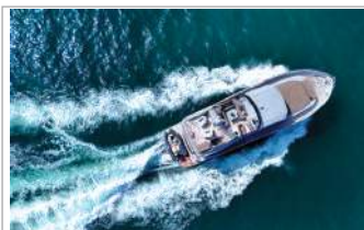
Sundeek Ephelide a motore, 17,35 m, 3 cabine, 6 ospiti, base Fiumicino - Calagalera (RM), da euro 21.000/settimana, tel. +39 06/87729042 - info@sea-seacharters.com