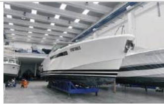
Delta Power 60 2020, 16,63 m, 2 x 600 HP Volvo Penta 600, tel. +39 347/1890139 - seatimeyachting@gmail.com