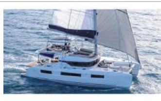
Lagoon 51 anno 2026, cabine 6+2, 14 posti letto, 4 bagni + 1 crew, numerosi comfort, imbarco Cala dei Sardi, tel. +39 06/94507580 - info@barcandocharter.com