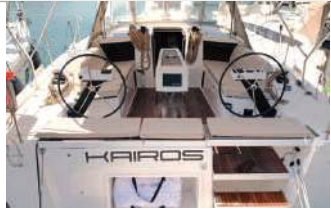
Dufour 430 2024, 4 cabine, 8+2 posti letto, 13,24 m, questa barca è la scelta ideale per chi desidera provare forti sensazioni in mare, tel. +39 345/6604940 - www.aladarsail.com