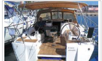
Dufour 405 40 piedi spazioso, volumi sottocoperta incredibili, carena performante, 12,17 m, 3 cabine, 1 bagno elettrico + 1, tel. +39 347/2733268 - info@carlofortesailcharter.it