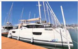
Fountaine Pajot 45 4 cabine + 1 crew, 5 bagni + 1 crew, base Marina d'Arechi, per Costiera Amalfitana, Isole Flegree e Isole Pontine, tel. +41 768377637 - booking@marinayachtcharter.com