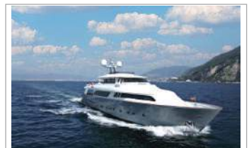
Ziacanaia 2024, 30,95 metri, 11 ospiti, 5 cabine, water toys, Marina di Stabia (NA), da euro 58.000/settimana, tel. +39 06/87729042 - info@sea-seacharters.com