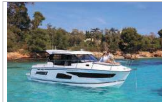
Merry Fisher 1095 10,4 m, 3 cabine ospiti, 1 bagno, Suzuki 2x300 HP, A/C, radio con CD, TV, imbarco Bacoli (NA), tel. +39 06/94507580 - info@barcandocharter.com